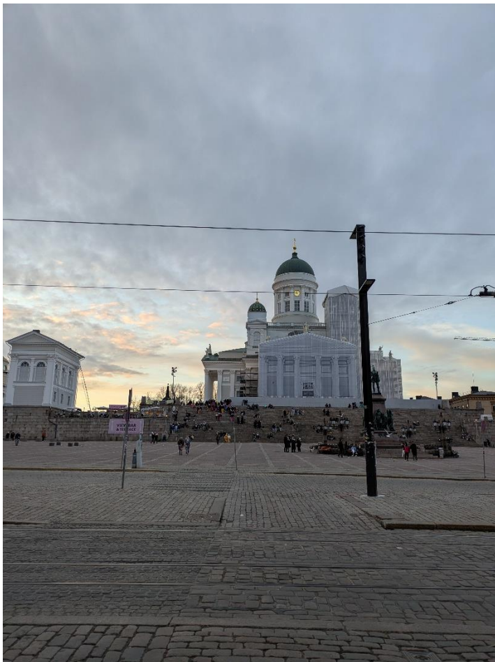
Dom von Helsinki bei Vappu (1.Mai)