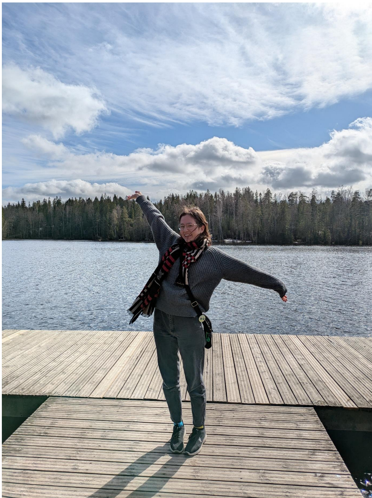
Kuusijärvi – See