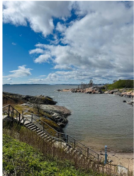
Suomenlinna (Seefestung vor Helsinki)