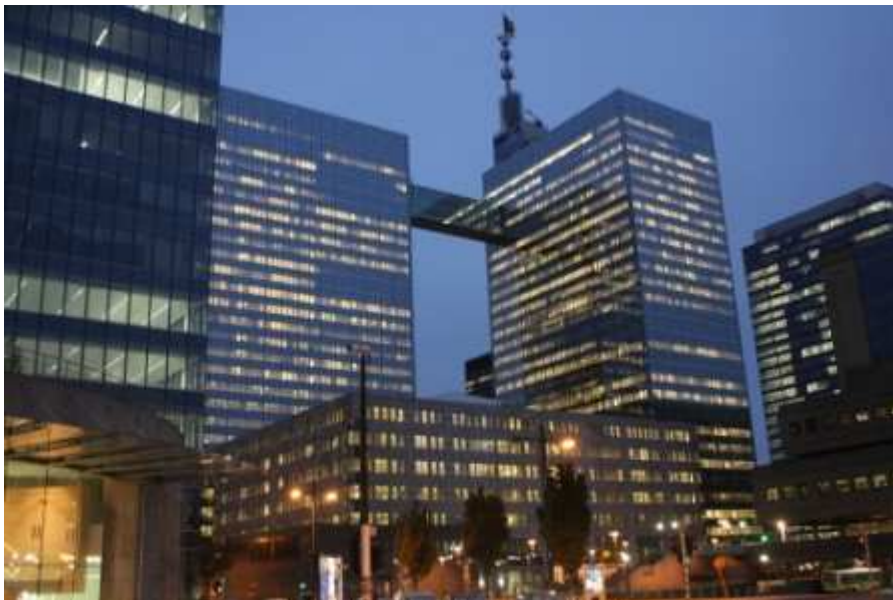
Teilweise verfasst von Julian Entrup

Nach dem Zweiten Weltkrieg etablierte sich Brüssel auch international als Zentrum: 1958 wurde es zum Sitz der EWG, der Vorläuferin der heutigen Europäischen Union. Im selben Jahr fand die zweite Brüsseler Weltausstellung statt, die das Atomium hinterließ. 1967 wurde der Sitz der NATO von Paris nach Brüssel verlegt und die modernen Gebäude im Europa-Viertel bilden schon quasi einen eigenen Stadtteil.